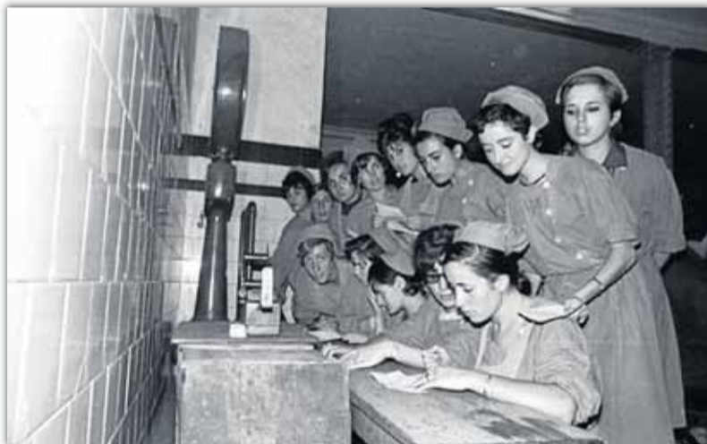
▲ Arriba, fábrica de Santander, cigarrera en máquina desvenadora; y Tabacalera, en la calle Alta, durante las elecciones sindicales de 1960. ► Estatuilla en acero acabado óxido del escultor Carlos López Nozal, que se entregará a los homenajeados tras la conferencia de hoy en el Paraninfo. ▼ Cigarrereras de la fábrica de Sevilla con máquinas liadoras de cigarrillos Vilaseca. Imagen tomada a principios del siglo XX.